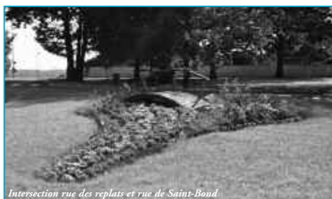
Intersection rue des replats et rue de Saint-Bond

Imprimerie Saint-Savinien TÉL. : 03 86 83 86 60