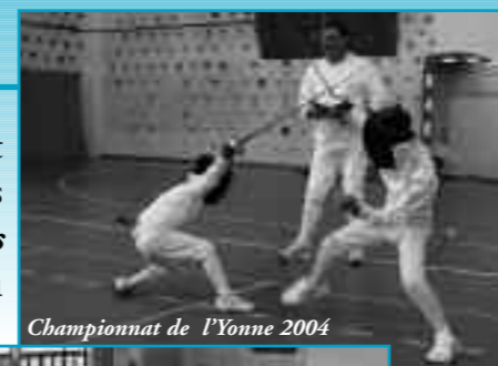
Championnat de l'Yonne 2004