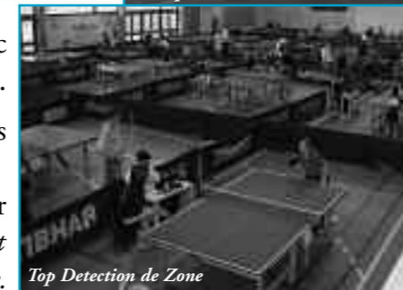
Top Detection de Zone

Que se passe-t-il cette semaine, ce mois, à Paron ? Que s'est-il passé cette année, l'année dernière ? Que s'est-il dit au dernier conseil municipal ? Qui contacter pour faire partie d'une association ? Comment mieux connaître l'histoire de Paron ? Comment présenter votre commune à des amis hors de la commune, du département ou à l'étranger ? A quoi ressemblait au siècle dernier ou ressemble aujourd'hui la commune de Paron ?