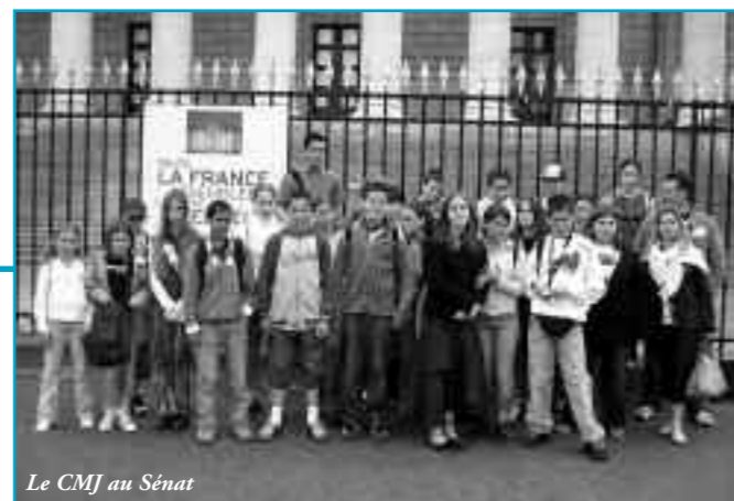
Le CMJ au Sénat

Achat de jeux de société pour la Ludothèque Municipale.